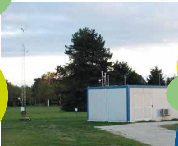
Super Site VOLTAIRE-HELIOS

Les ensembles expérimentaux qui constituent PRAT permettent des études complémentaires en laboratoire et sur le terrain :